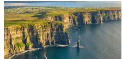
IRLAND & NORDIRLAND →