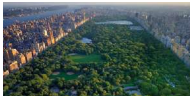
VEREINIGTE STAATEN →